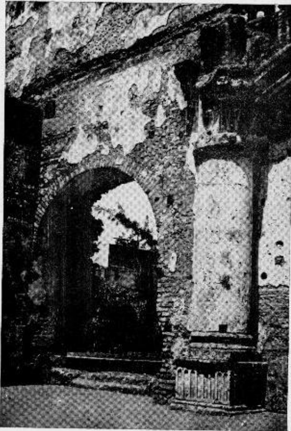
Fig. 15.— HOSPITAL DE SAN NICOLAS, Arquería del Crucero.